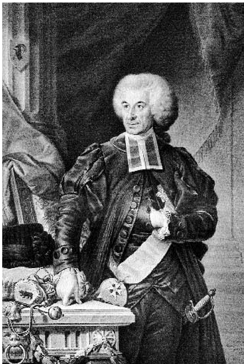
Niklaus Friedrich von Steiger (1729–1799) war der letzte Schultheiss des alten Bern.

Steiger gegenüber, der das Alte so nachhaltig verkörpert, dass er sein Überleben dazu nutzen will, «das Neue mitzugestalten und ihm den Geist des Alten einzuhauchen», vertritt die unehelich geborene Maria die Unterdrückten und